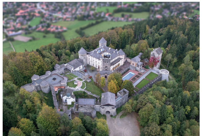
Schloss Ringberg, Tagungsstätte der Max-Planck-Gesellschaft am Tegernsee.

Da aus dem öffentlichen Haushalt keine Gelder für Baumaßnahmen verwendet werden dürfen, stellt dies die Max-Planck-Gesellschaft vor große finanzielle Herausforderungen: Für verschiedene Sanierungsprojekte werden ca. 500.000 Euro benötigt. Hier kann Ihre Spende einen wichtigen Beitrag leisten.